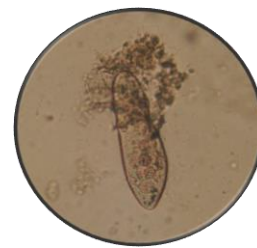
顕微鏡をのぞくと微生物が！

小冊子にある微生物と見比べて微生物の種類、また微生物の動き等を観察してください。